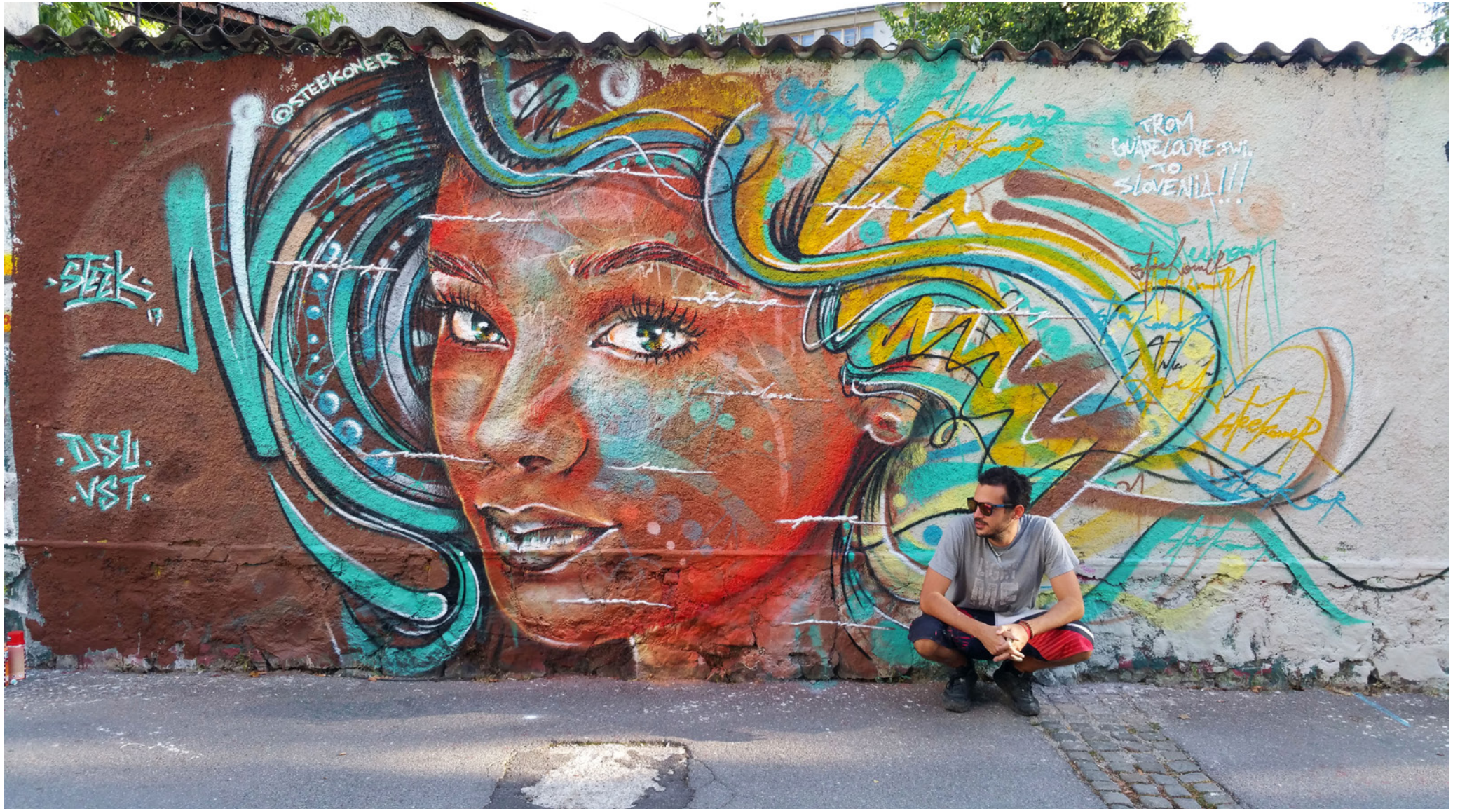
Slovénie (Slovenia) 2017 - ROG wall