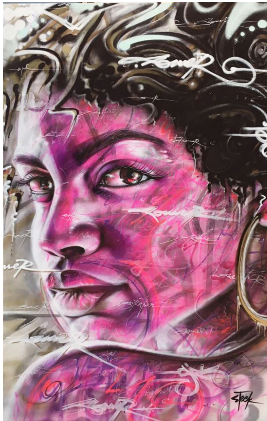
POWER (acrylic) Spray, airbrush, marker 170x104cm