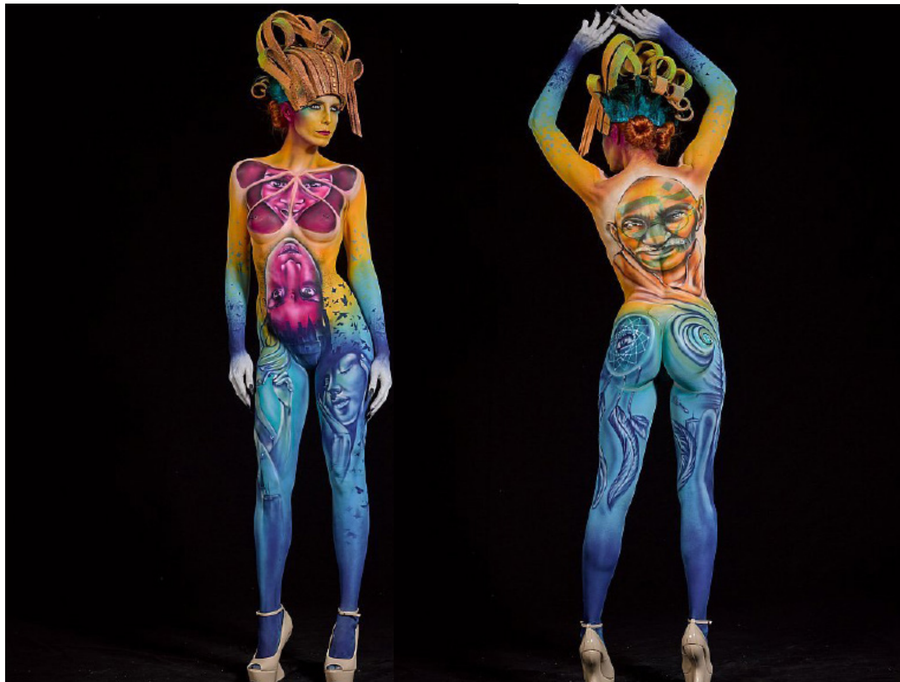
Day 1 - World Championship - Theme : Utopia