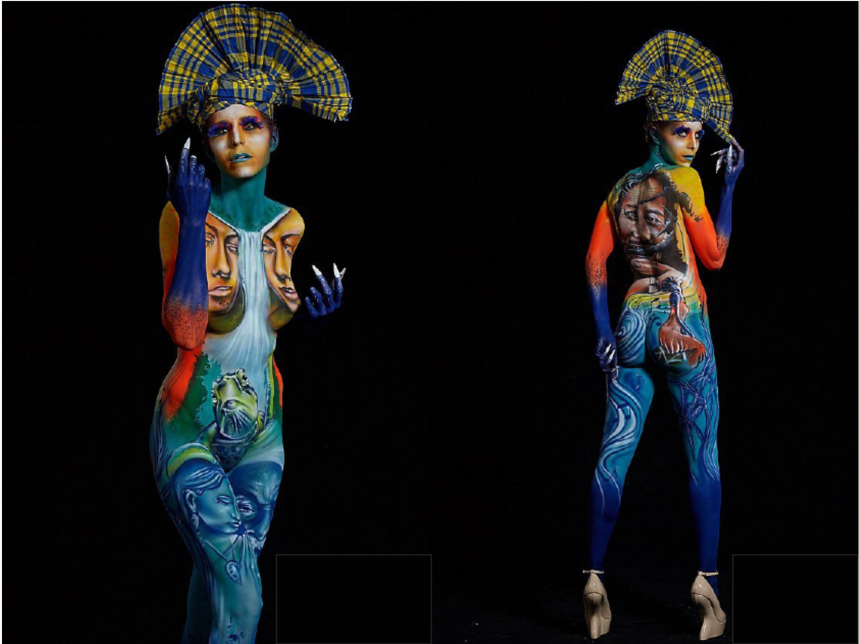
Day 2 (Final) - World Championship - Theme : Your culture