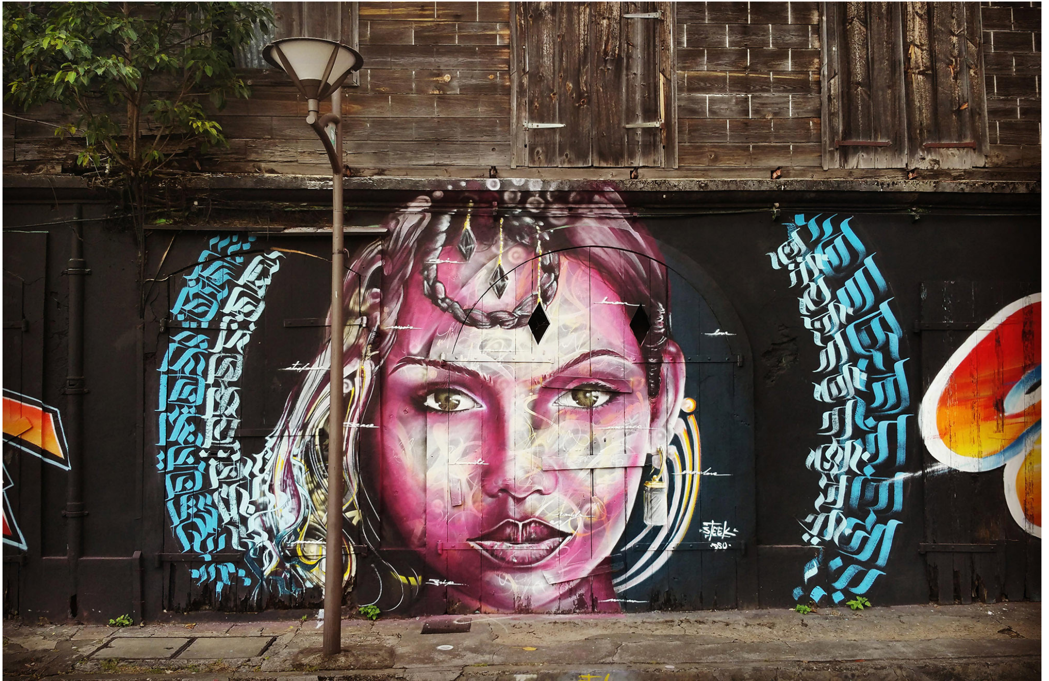
Guadeloupe 2017 (calligraphy by Osons)