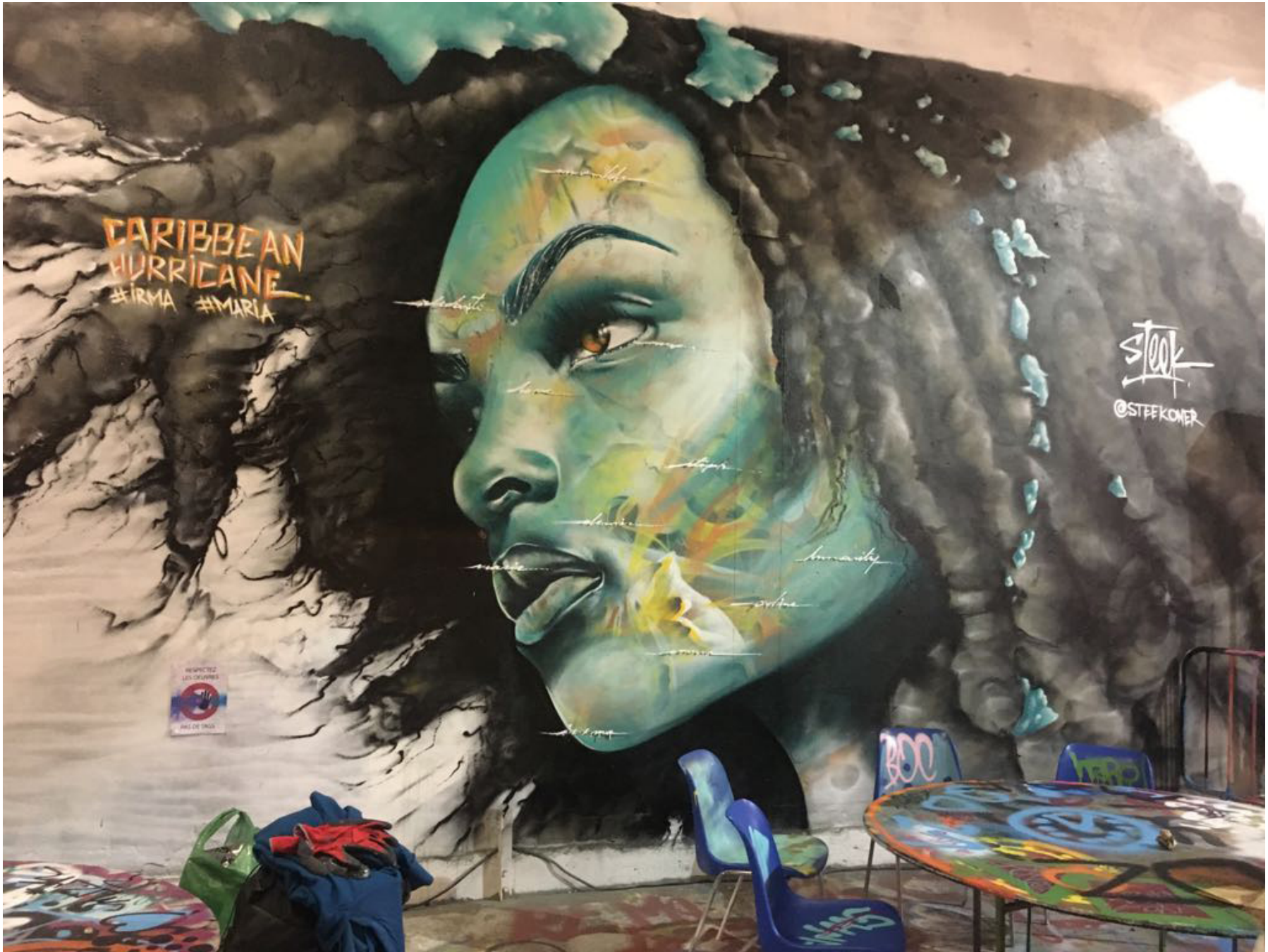
Paris 2017 - L'Aérosol