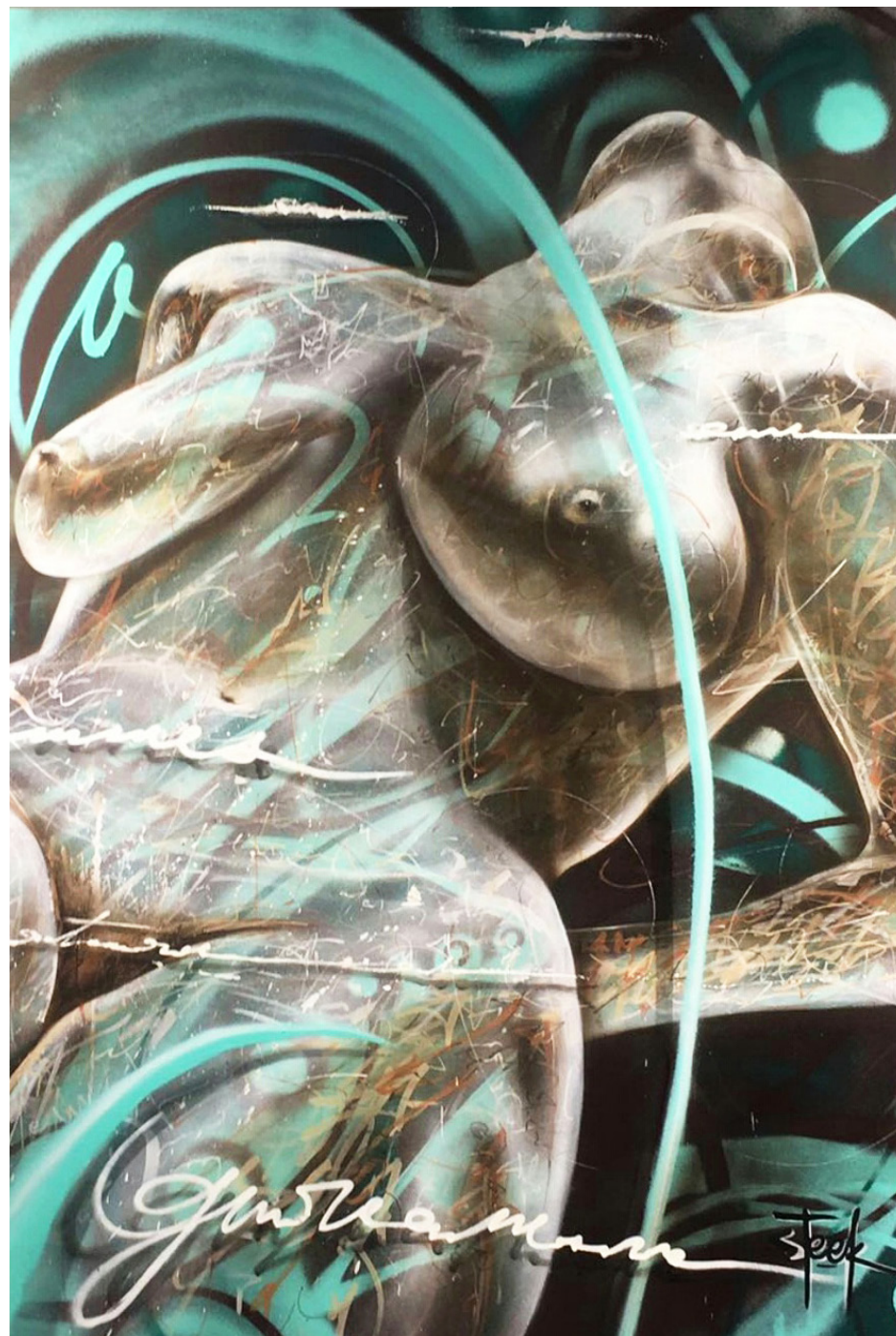
Généreuse (acrylic) Spray, airbrush, marker 141x95cm