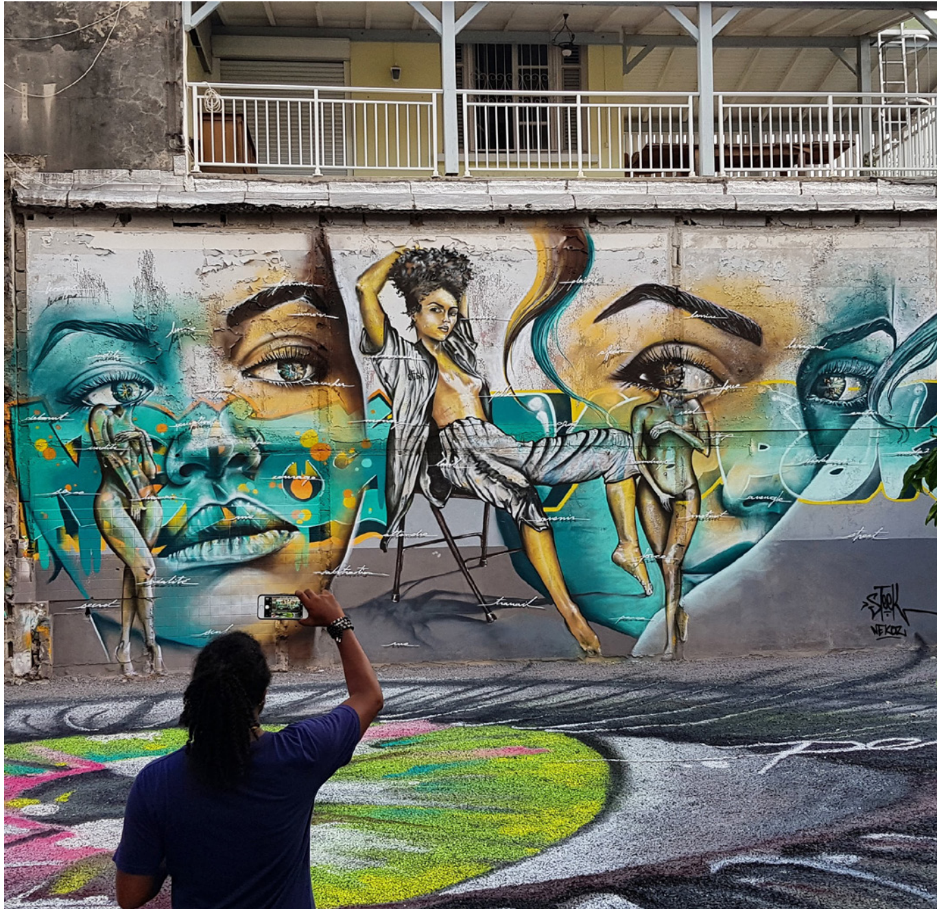
Guadeloupe - Pointe-à-Pitre 2018