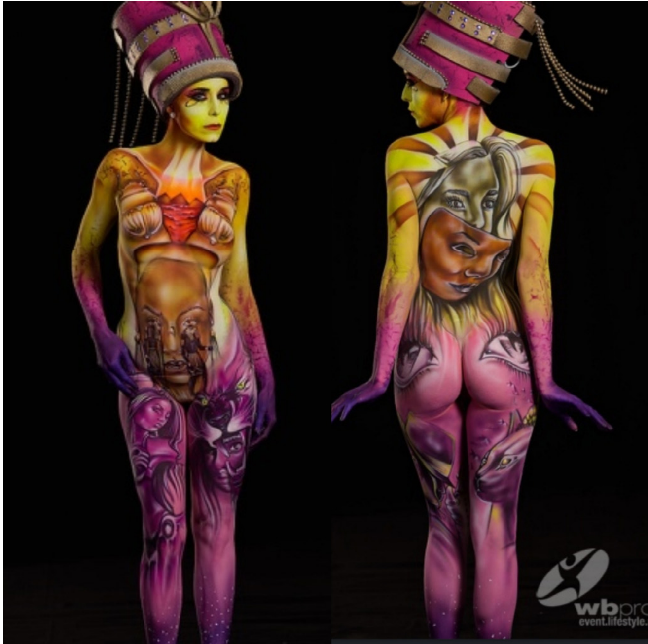
Day 1 (Qualifications) - World Championship - Theme : Glamour of the past