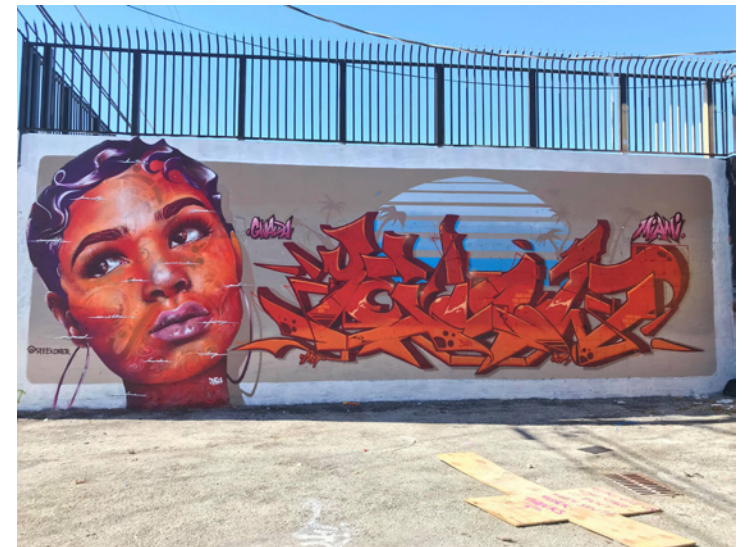
Miami Wynwood 2017 during Art Basel