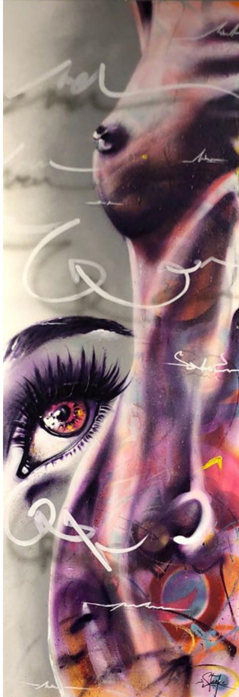
How they look 2 (acrylic) Spray, airbrush, marker 150x50cm