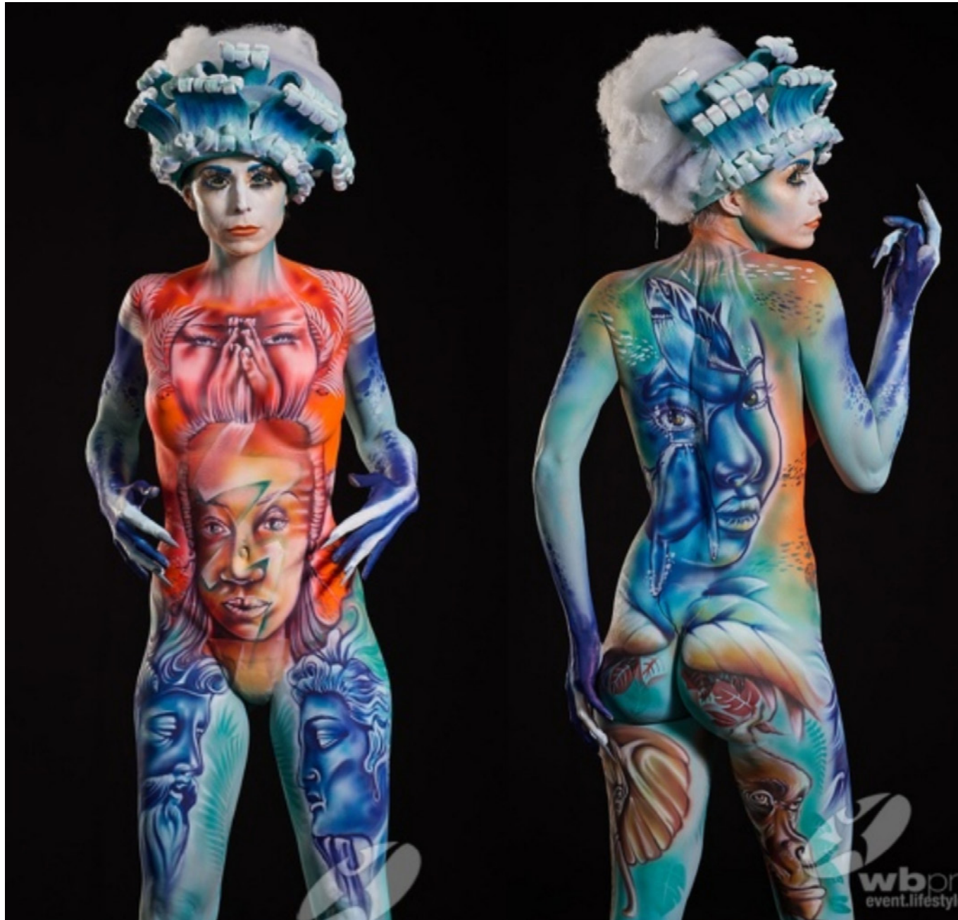
Day 2 (Final) - World Championship - Theme : I had a dream