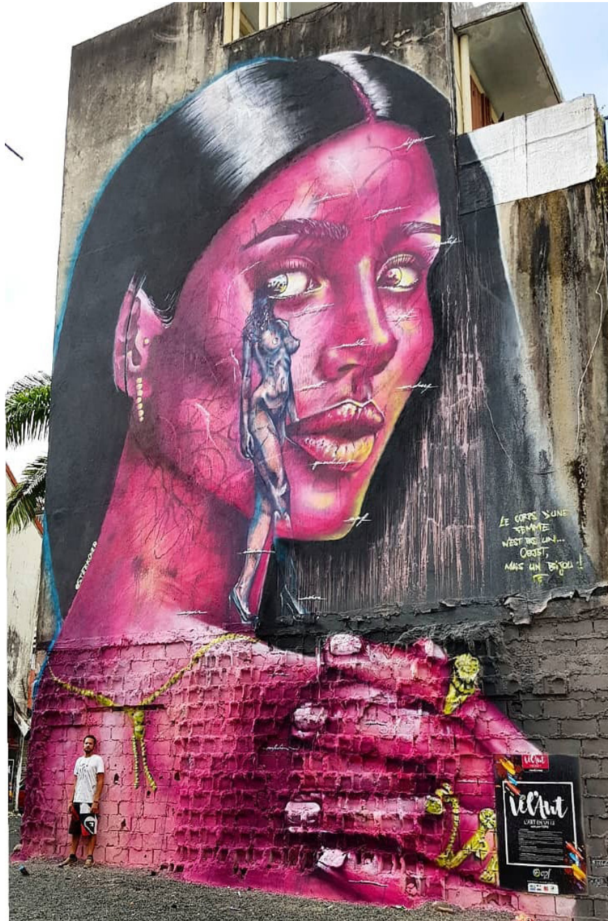
Guadeloupe - Pointe-à-Pitre 2018