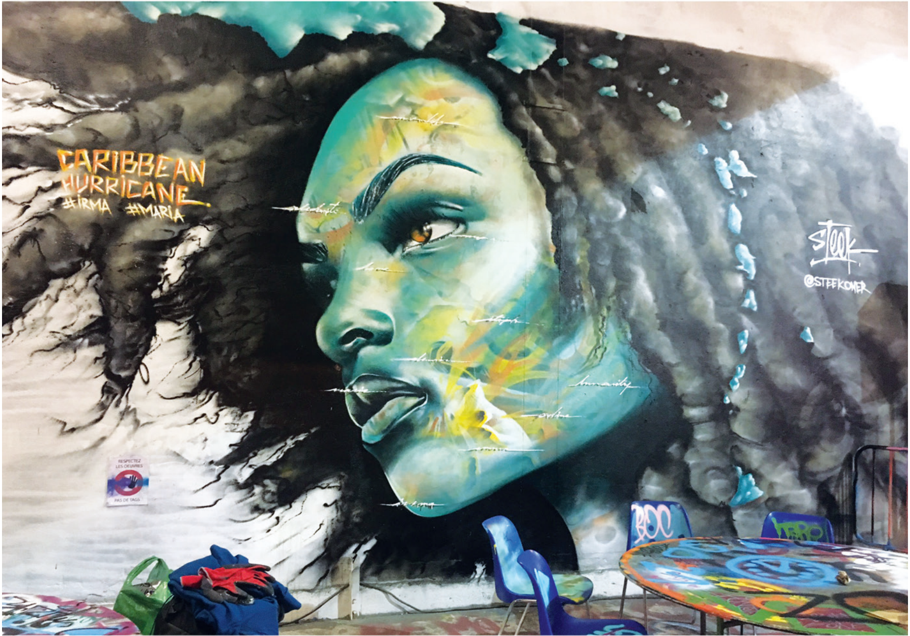
Paris 2017 - L'Aérosol