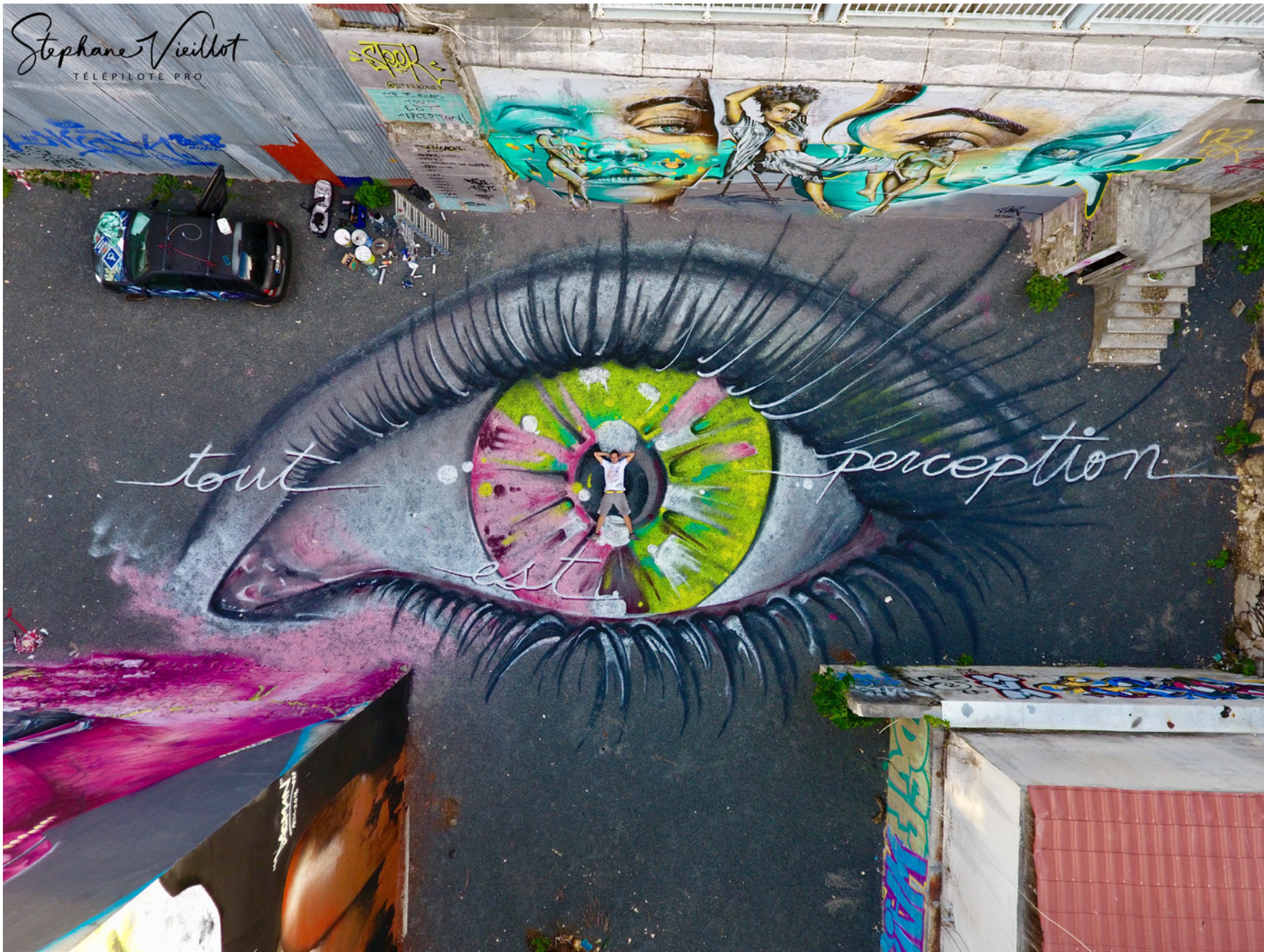
Guadeloupe - Pointe-à-Pitre 2018